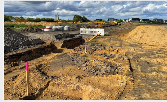
IM NEUBAUGEBIET ›WOHNEN AM FREER BRUCH‹ FINDEN DIE ERSTEN BAUARBEITEN STATT.

Von der Bergbausiedlung zum neusten Baugebiet ›Wohnen am Freer Bruch‹ – seit fünf Jahrzehnten überzeugt die Volksbank Immobilien GmbH Käufer und Verkäufer mit Ortskenntnis und lokaler Nähe. Entstanden ist dabei ein großes Netzwerk aus Kontakten und Wissen um den Immobilienmarkt der Region.