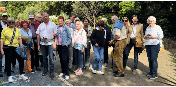
09.05. IN DIESEM JAHR FÜHRTE DIE VORSTANDSREISE IN DIE PROVENCE UND AN DIE CÔTE D'AZUR.